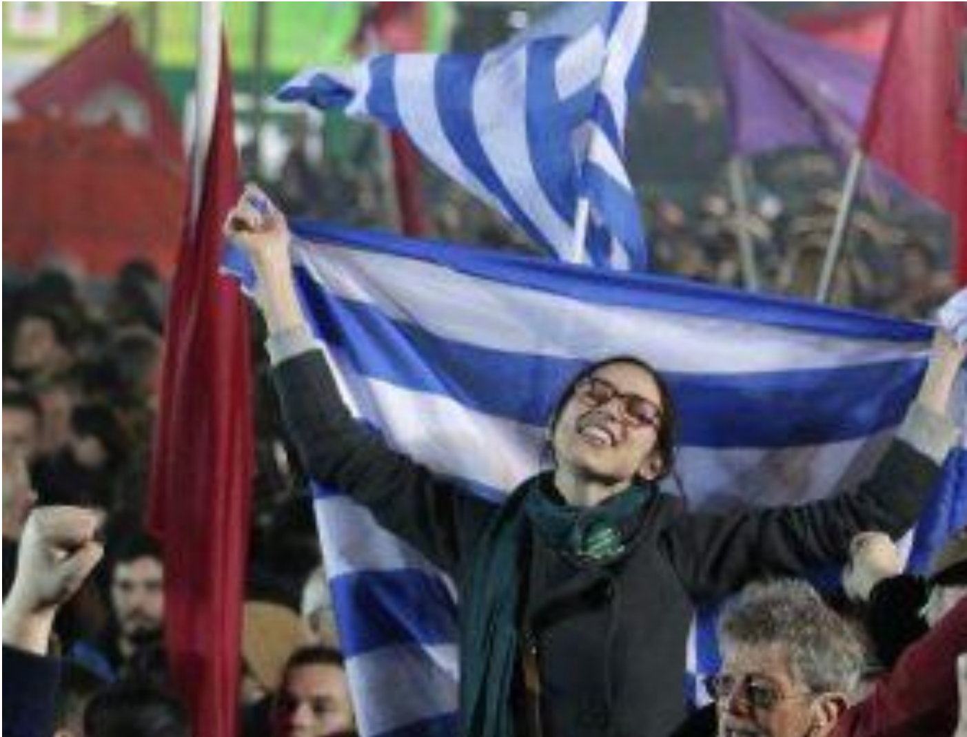
Au soir de la victoire de Syriza aux élections législatives du 25 janvier 2015, les drapeaux grecs étaient de sortie.

Nous n'avons pas pu éviter l'affrontement au second tour entre Macron et Le Pen, c'est vrai, mais il s'en est fallu de peu. Nous sommes passés tout près d'une transformation historique qui est en réalité déjà en marche et qu'on peut d'ores et déjà observer. Il n'est pas nécessaire de se proclamer populiste en permanence, ce qu'il faut faire, c'est comprendre le populisme et le mettre en pratique. Ensuite, chacun se dénomme comme il l'entend. En Grèce, Syriza continue de se présenter comme une coalition de gauche radicale, mais en réalité, ils ont remporté les élections en arborant le drapeau grec et en défendant l'intérêt national de tous les Grecs face aux politiques d'appauvrissement et de mise à sac du pays imposées par la Troïka. S'ils veulent continuer de se définir comme le parti de la gauche radicale, cela n'a pas vraiment d'importance.